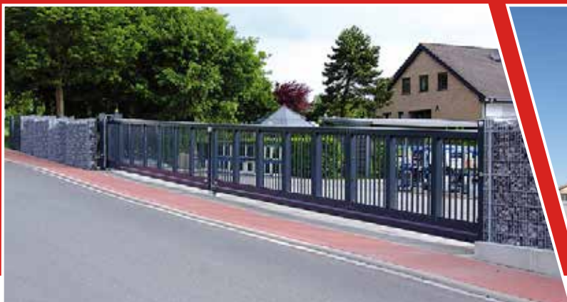
Schiebetore & Drehtore