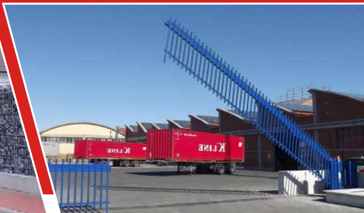
Vertikal öffnende Tore